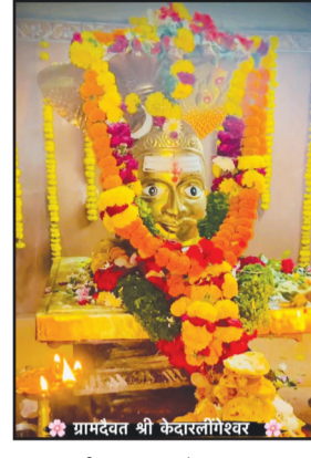
१८) रोजी सायंकाळी सात वाजता मंदिरात दीपोत्सव साजरा करण्यात येणार आहे. त्यानंतर महाप्रसादाचे

तुळजापूर (विजय पिसे) - तालुक्यातील जळकोट येथील ग्रामदेवत श्री केदारलिंगेश्वर देवस्थान ट्रस्टची यात्रा गुढीपाडव्या दिवशी पार पडणार आहे. यात्रेनिमित्त विविध धार्मिक कार्यक्रमांचे आयोजन करण्यात आले आहे जळकोट गावचे ग्रामदेवत असलेल्या श्रीकेदारलिंगेश्वर देवालयाची यात्रा दरवर्षी गुढीपाडव्याच्या दिवशी पार पडत असते. याही वर्षी यात्रेनिमित्त मंदिरावर आकर्षक विद्युत रोषणाई करण्यात आली असून बुधवार ( दि.