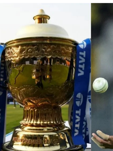
लक्ष्य गाठता आलं असतं. ऋतुराज एक