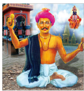
लेखी सर्व त्याचीच लेकरे आहेत ना, मग असा दुजाभाव का ?' असे प्रश्न त्यांच्या मनात निर्माण होऊन ते व्यथित होतात दिसतात. त्यांच्या अभंगरचना हृदयाला भिडणा-या आहेत. 'धाव घाली विदू आता। चालू नको मंद।