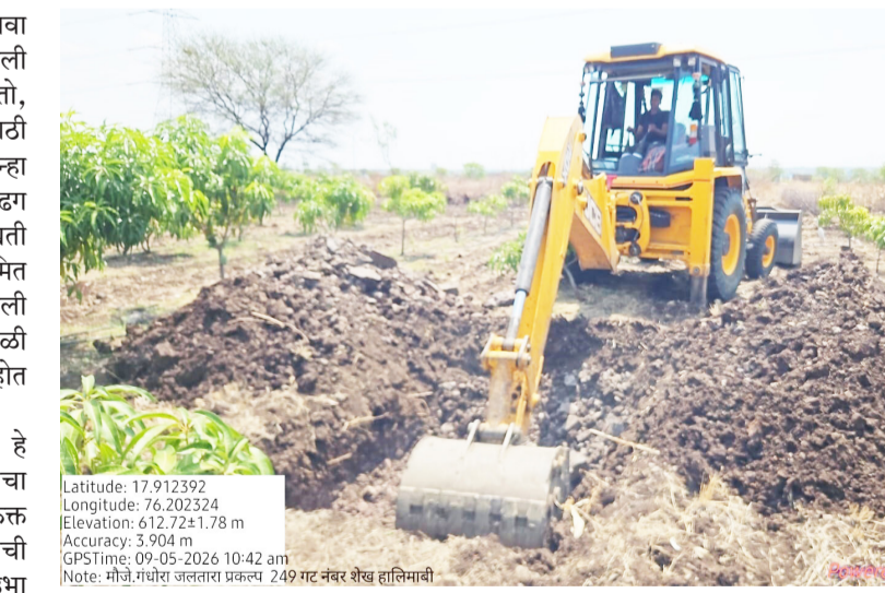
भरलेल्या राहू लागल्या आहेत.काही भागांत भूजल पातळी वाढल्याचेही चित्र दिसून येत आहे. विशेष म्हणजे या अभियानाने दुष्काळाकडे पाहण्याचा दृष्टिकोन बदलला आहे.पूर्वी पाणीटंचाई आली की फक्त शासनाकडे मदतीची अपेक्षा ठेवली जात होती; मात्र आता गावकरी स्वतः पुढाकार घेत जलसंधारणाच्या कामांत उतरू लागले आहेत.युवकांचे श्रमदान, महिला बचत गटांचा सहभाग, शेतकऱ्यांचे नियोजन आणि सामाजिक संस्थांची साथ यामुळे जलतारा आता लोकचळवळ बनू लागले आहे. धाराशिवसारख्या जिल्ह्यासाठी भूभागीतील पाण्याची पातळी वाढविणे ही काळाची सर्वांत मोठी गरज आहे.कारण येथील शेती आणि पिण्याच्या पाण्याचा मोठा आधार भूजलावरच आहे.पावसाचे पाणी जमिनीत मुरले तरच विहिरी आणि बोअरवेल जिवंत राहू शकतात.त्यामुळे पडणारा प्रत्येक थेंब अडविणे आणि जिरविणे ही आता निवड नसून

अशा परिस्थितीत जलतारा अभियान हे केवळ प्रशासनाचे अभियान न राहता आशेचा नवा किरण ठरत आहे.कारण ही मोहीम फक्त पाणी अडविण्याची नाही,तर भविष्य वाचविण्याची आहे पुढील पिढ्यांच्या अस्तित्वासाठी उभा राहिलेला सामूहिक संकल्प आहे. पाणी म्हणजे केवळ तहान भागविणारे साधन नाही; ते शेतीचे जीवन,जनावरांचा आधार,ग्रामीण अर्थव्यवस्थेचा कणा आणि प्याविरणाचा धास आहे.म्हणूनच आज पाणी अडवा, पाणी जिरवा ही संकल्पना घोषणांपुर्वी मर्यादित न राहता प्रत्यक्ष कृतीत उतरविण्याची वेळ आली आहे. जलतारा अभियानातून धाराशिव जिल्ह्यात हीच जाणिव लोकांच्या मनामनात रुजताना दिसत आहे.