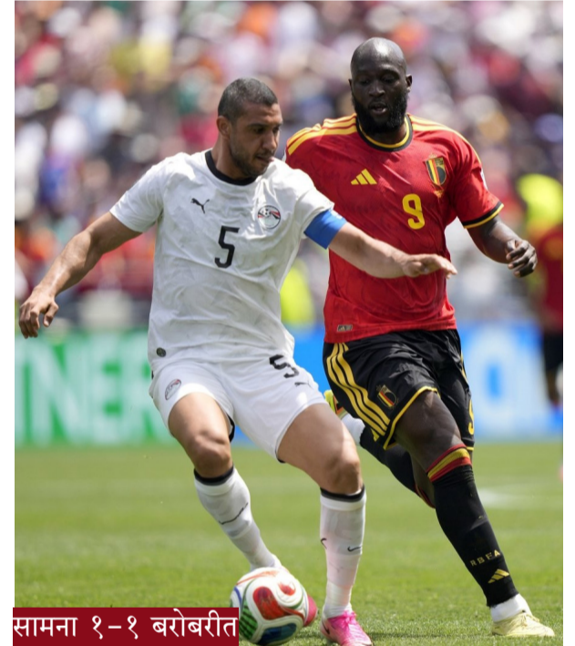
सामना १-१ बरोबरीत