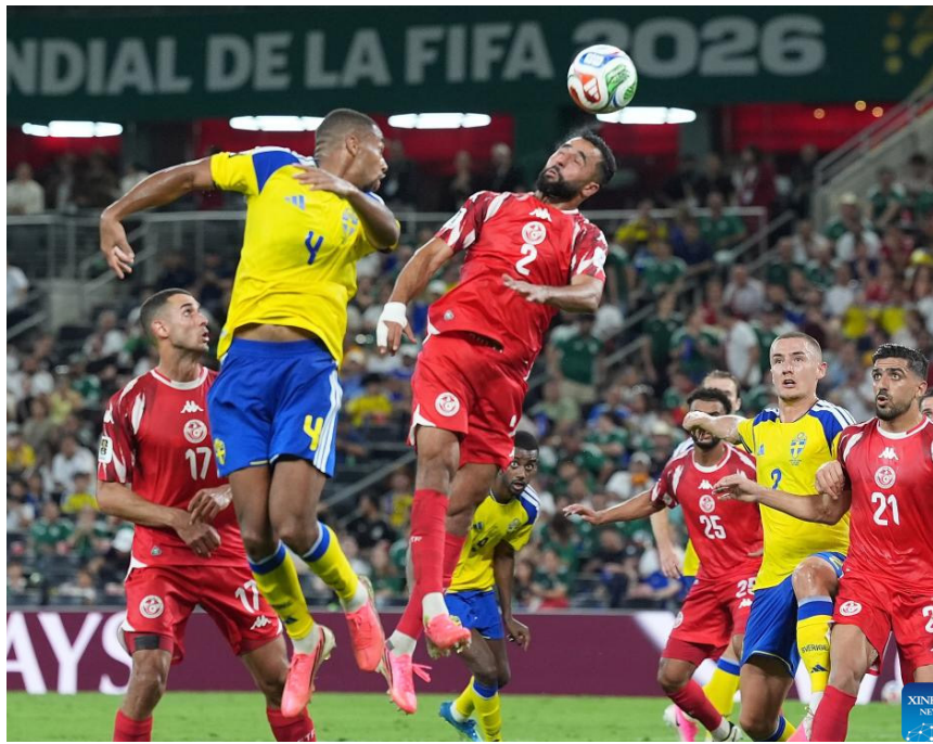
ट्युनिशियाकडून ओमर रेकिकचा एकमेव गोल; स्वीडनने 'फ' गटातील सामन्यात निर्माण केला दबदबा; विश्वचषक फुटबॉल स्पर्धेत ट्युनिशियाविरुद्ध दोन शानदार गोल करून

मॉन्टेरी (मेक्सिको) : यासीन अयारीने केलेल्या दोन गोलच्या जोरावर स्वीडनने २०२६ च्या विश्वचषकात आपला दबदबा निर्माण करताना 'फ' गटातील सामन्यात ट्युनिशियाचा ५-१ असा पराभव केला. या मोठ्या विजयासह स्वीडनने गटात गुणतालिकेत अव्वल स्थान पटकावले. स्वीडनच्या या विजयात अलेक्झांडर इसाक आणि व्हिक्टर ग्योकेरेस यांनी प्रत्येकी एक गोल करण्यासह एका गोलसाठी सहाय्य केले. अन्य एक गोल मथायस स्वानबर्गने नोंदवला. जागतिक क्रमवारीत ३९ व्या स्थानावर असलेला स्वीडनचा संघ २०२२ च्या विश्वचषकासाठी पात्र ठरू शकला नव्हता. दुसरीकडे, ट्युनिशियासाठी ओमर रेकिकने एकमेव गोल केला. वडिलांच्या देशाबद्दल आदर पहिल्या गोलनंतर अयारीने जास्त जल्लोष केला नाही; त्याने ट्युनिशियाबद्दल आदर व्यक्त करण्यासाठी फक्त आपले हात वर केले, कारण त्याच्या वडिलांचा जन्म ट्युनिशियामध्ये झाला आहे.